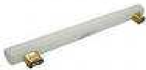
LINESTRA 2 CONTACTOS