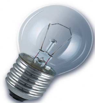
GOTA SILICA E-27