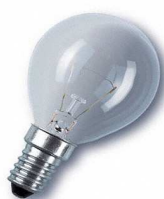
GOTA SILICA E-14