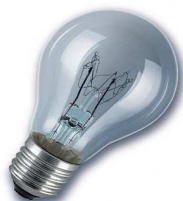
CENTRA CLARA REFORZADA

REFORZADA CENTRA CLARA Son especialmente resistente a golpes y sacudidas mediante la sujecion reforzada del espiral . Conexión directa a 220V.