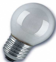
GOTA SILICA E-27