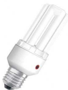
DULUX EL SENSOR

DULUX STAR TRITUBO Esta lampara compacta ofrece una alta eficiencia luminosa con un 80% de ahorro de energia. Para aplicacion comercial y en el hogar.