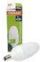
DULUX CLASSIC B