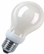
DULUX CLASSIC A